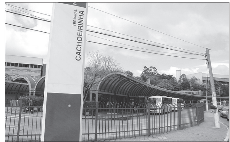
Terminal de ônibus de Vila Nova Cachoeirinha é referência para muitos outros bairros