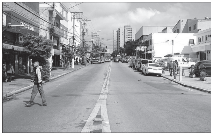
Apesar de movimentadas, avenidas não têm faixa exclusiva de ônibus