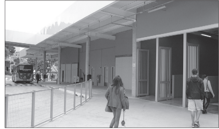
Terminal de ônibus