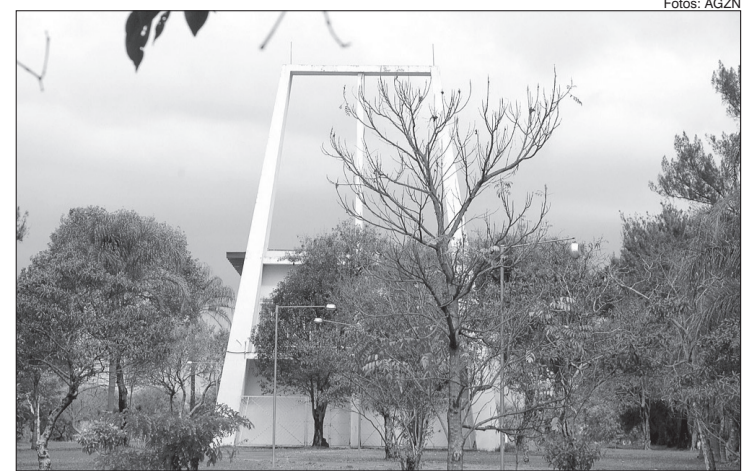
Cemitério de Vila Nova Cachoeirinha está entre os principais da cidade