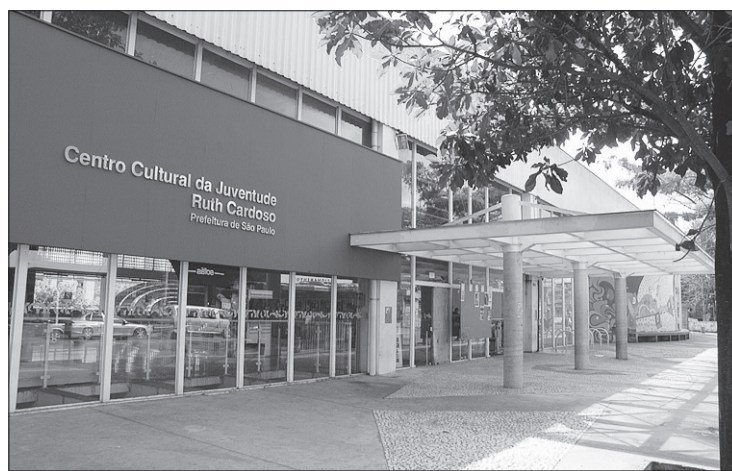
Centro Cultural da Juventude - Ruth Cardoso é referência cultural na região

Quanto aos importantes equipamentos culturais da região, Centro da Juventude Ruth Cardoso e Fábrica de Cultura, é citada a necessidade de programações diferenciadas e maior número de opções. Outro serviço primordial citado é o Hospital Geral de Vila Nova Cachoeirinha, que necessita de ampliação e maior número de médicos para atender a demanda. Outra reclamação constante da região refere-se às condições do Cemitério de Vila Nova Cachoeirinha com relação às suas condições de manutenção e limpeza. A expectativa de melhoria a médio e longo prazo refere-se ao processo de concessão da administração dos cemitérios da cidade, defendida pela atual gestão municipal.