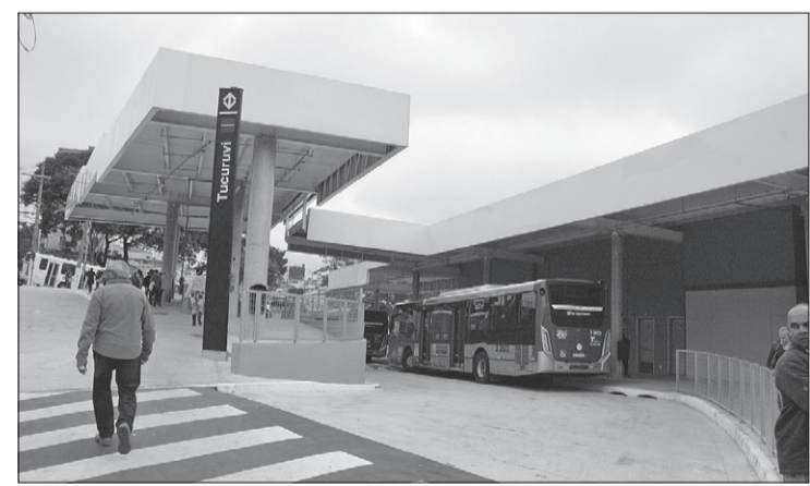
Entrada do Terminal