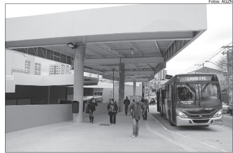
Ônibus parando no local onde estão estudando a transferência do ponto localizado logo atrás

O novo terminal deve atender mais de 20 mil pessoas que passam pelo local, das 4h40 às 0h14, de domingo a sexta-feira, e das 4h40 à 1 hora, do sábado para o domingo.